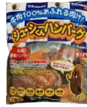
すぎもとミート ジューシーくんハンバーグ