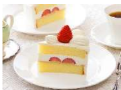
銀座コーギーコーナー

銘店コーナーでは、「銀座コーギーコーナー」のケーキをはじめ、「ユーハイム」「ありあけ」など全国の有名ブランドから、「田子の月」（富士市）や「長坂養蜂場」（浜松市）、「たこ満」（菊川市）、「ヤタロー」（浜松市）などの地元ブランドまで34のブランドを展開します。