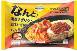
トップバリュ ベストプライス ガッツリ飯シリーズ