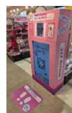
ARバーチャルメイク

売場に設置してある専用タブレットの画面に自身の顔を映し、気になる商品の色味や質感のシミュレーションができるサービス「ARバーチャルメイク」を導入します。お客さまが気になるベースメイクやアイメイク、リップなどの商品をタッチアップせずに様々なブランドを同時にお試しいただけ、気軽に商品を選定できます。