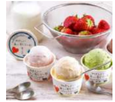
サンオーネスト やさしいあいすくりーむ