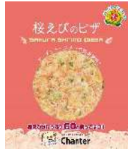
シャンテ 駿河産桜えびのピザ